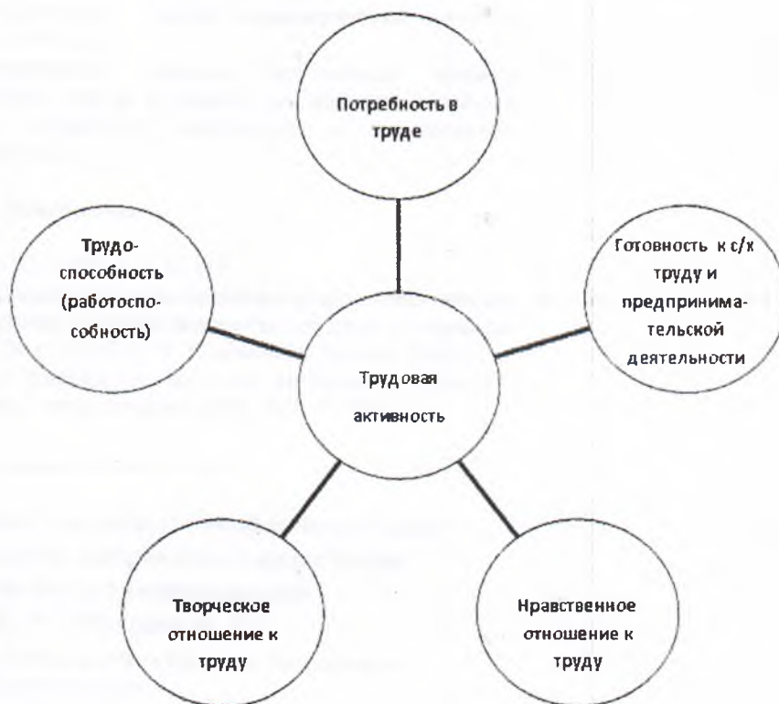
Рис. 1. Структура трудовой активности

Сказанное позволяет нам обозначить следующую структуру трудовой активности (рис. 1).