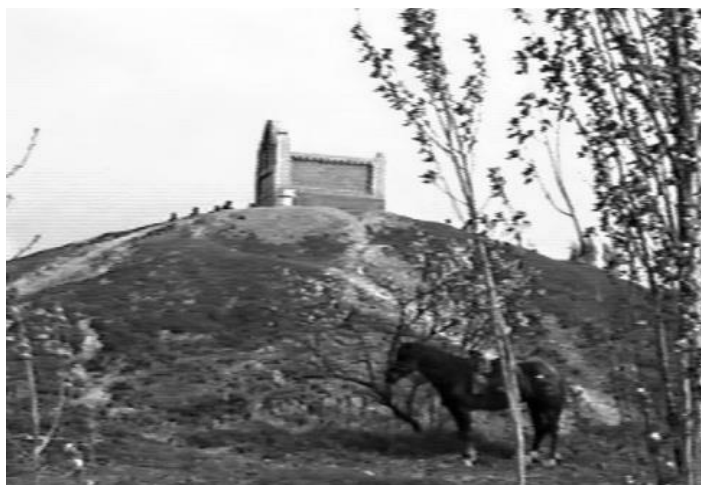
2-сүрөт. Жедигер уулу Мөнкөнүн күмбөзү 1668-ж. Өзбекстан Республикасы Курама айылы