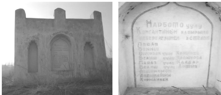
3-сүрөт. Нарбото уулу Кангайты бийдин күмбөзү