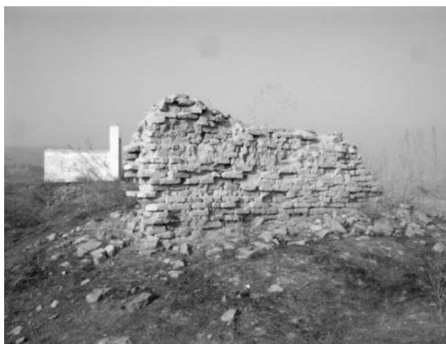
4-сүрөт. Нарбото бийдин күмбөзү.

Эшен, кожо, молдолордун туура берген кеңеши менен Нарботого шейит кеткендиктен корумдалып, алды тарабына дубал тургузулуп, күмбөз тургузулган эмес.