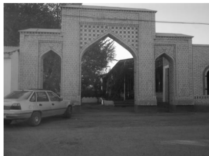
5-сүрөт. Кангайты бий медресеси Андижан обл, Пахтабат р-ну, Маданият с. (Нотакара айылы азыркы Маданият көчөсү)