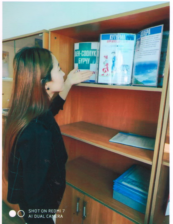
SHOT ON REDMI 7 AI DUAL CAMERA