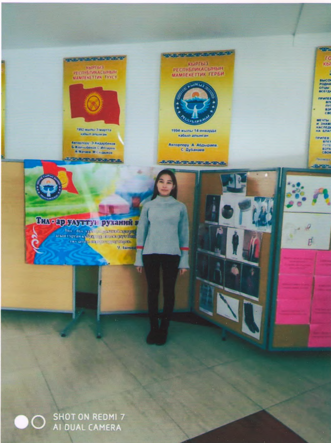
SHOT ON REDMI 7 AI DUAL CAMERA