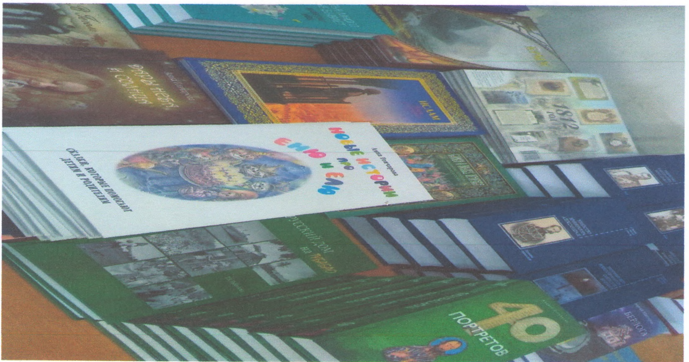
Дессертация жана китептерди кабыл алып текшерип, ИРБИСКЕ киргизуу.