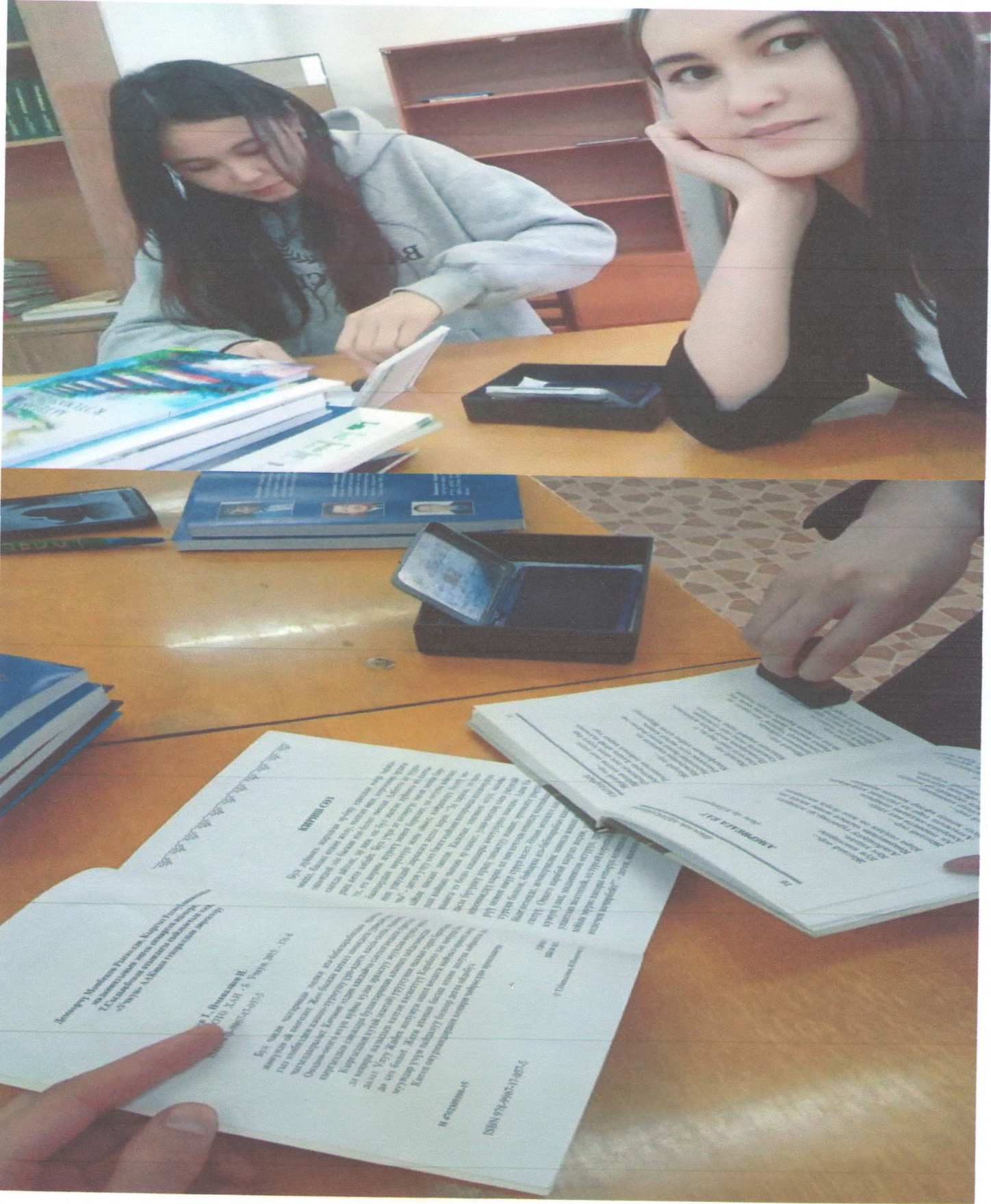
Китептерди кабыл алып, аларга печать басып жаткан учурубуз.