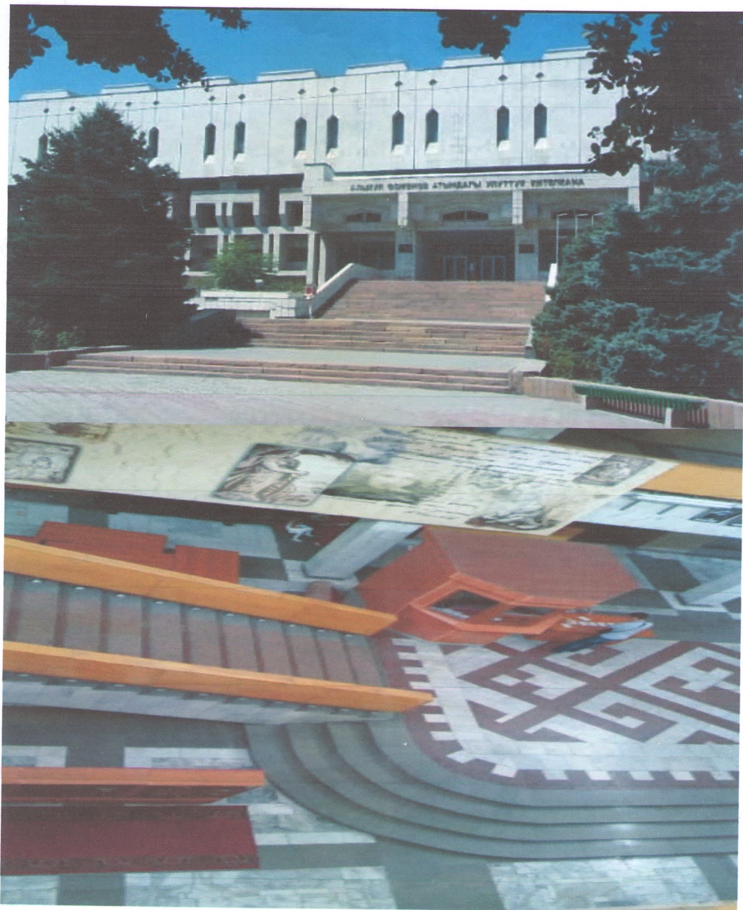
А.Осмонов атындагы библиотека