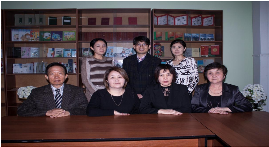
Тил даярдыгы жана котормо кафедрасынын жааматы