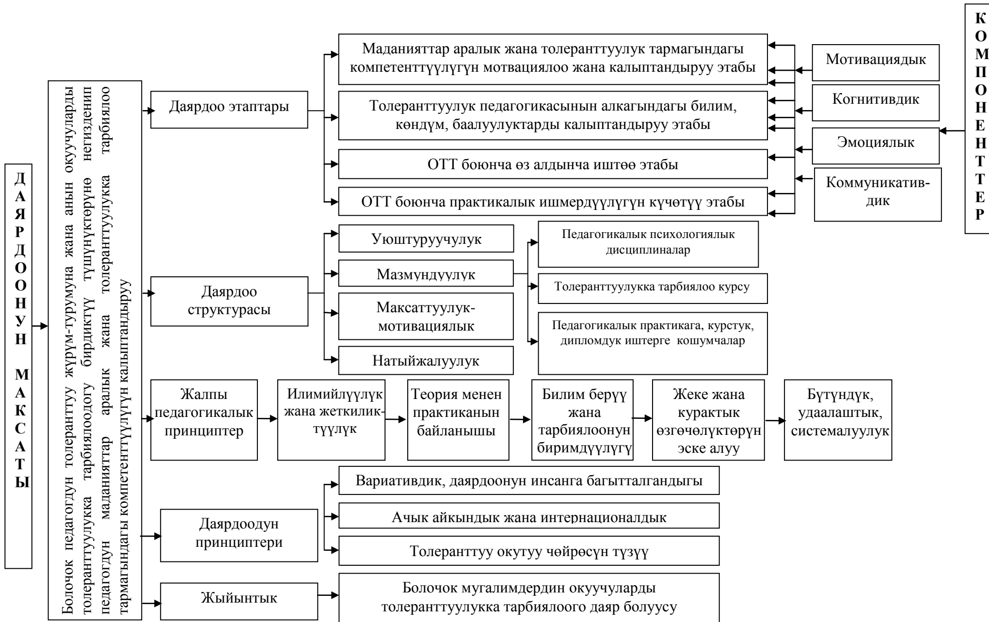
2-сүрөт. Окуучуларды толеранттуулукка тарбиялоого болочок мугалимдерди даярдоонун модели